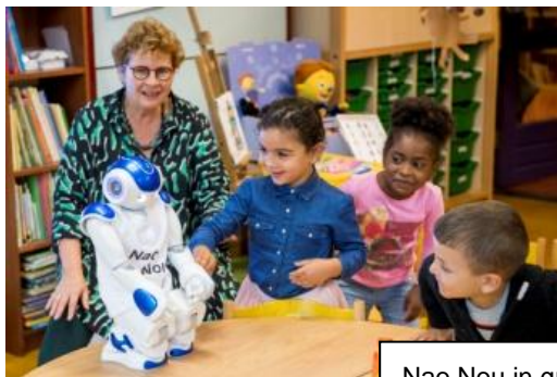
Nao Nou in groep geel