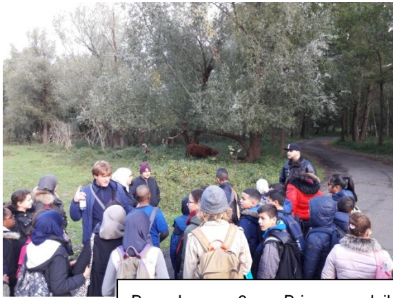
Bezoek groep 8 aan Brienenoordeiland