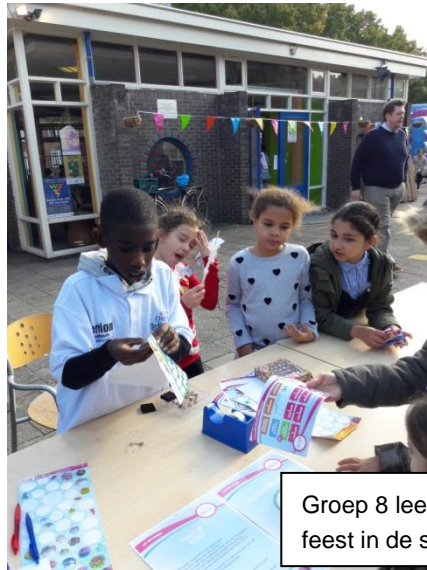
Groep 8 leerlingen organiseerden een feest in de speeltuin