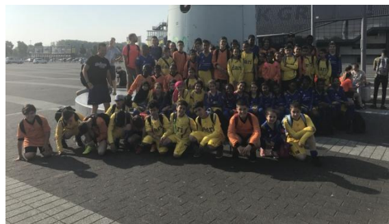
Het team van De Boog Schiemond wenst u een heel fijne vakantie!!!