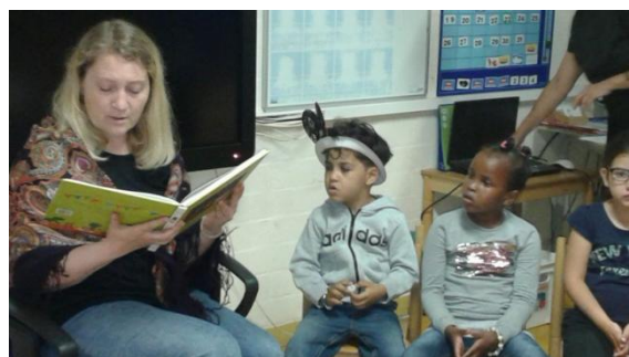
Foto's van The Final, het Voorleesfeest en het optreden van de wijkmuziekschool in het theater Zuidplein.