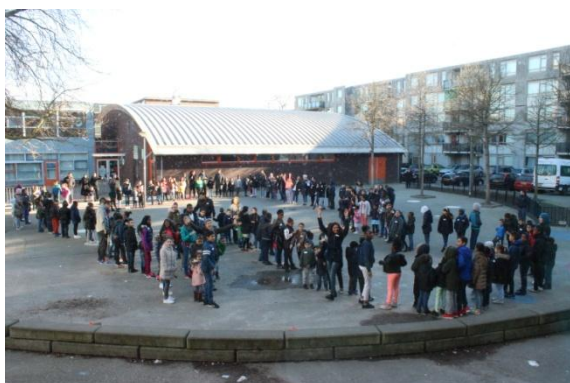
De Grote Rekendag: Met zijn allen op het plein op volgorde van huisnummer