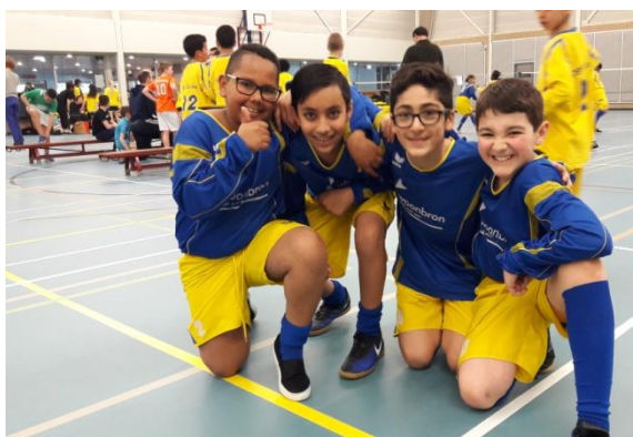
Smashbaltoernooi Door naar The Final!