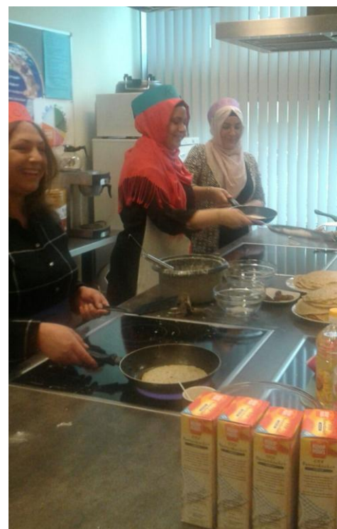
Thema Beroepen: Wat fijn dat er altijd moeders bereid zijn om te helpen!